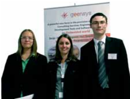
Au terme d'une journée de compétition, c'est finalement l'équipe de Polytech'Savoie qui a remporté le Challenge ControlBuild !

L a société Geensys et HEI ont organisé l'édition 2008 du Challenge ControlBuild, un concours ouvert à tous les étudiants d'écoles d'ingénieurs et d'universités passionnés par les systèmes automatisés. La finale a eu lieu le 5 juin dans les locaux de l'école et a récompensé trois équipes évaluées par un jury, composé de représentants académiques et industriels.