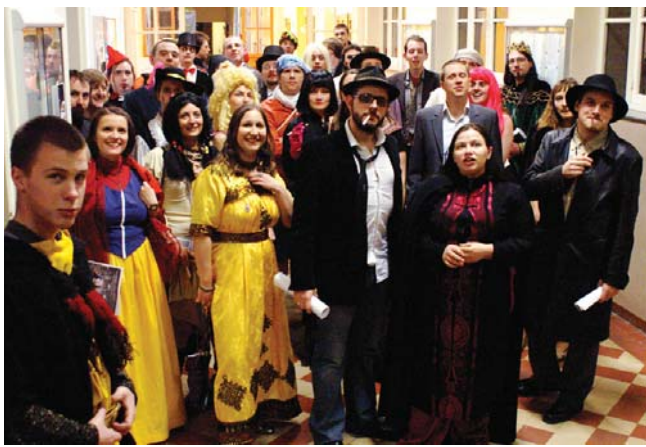
Une photo souvenir digne d'un album du jeu "où est Charlie ?"

L e rendez-vous attire chaque année des centaines de visiteurs. Pour leur XIII ème édition, les Croisades d'Unnord ont eu lieu du 22 au 24 mars, autour du thème « Mort et Malédiction ». Cette incontournable convention de jeux de rôle a transformé pour l'occasion l'école en château médiéval !